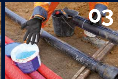
03 Lubrifier le joint d'étanchéité