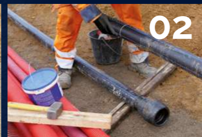
02 Nettoyer la surface du tube