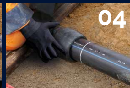
04 Emboîter le tube jusqu'à l'indicateur d'insertion