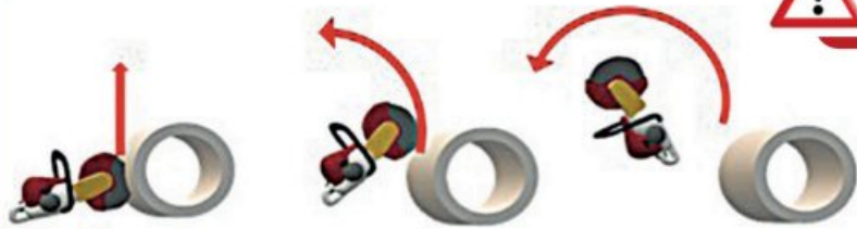
Illustration du rebond

Ne pas utiliser le \frac{1}{4} supérieur du disque